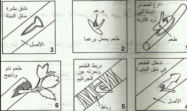
1- التطعيم بالبراعم