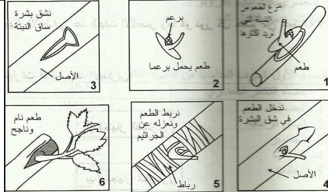
1- التطعيم بالبراعم