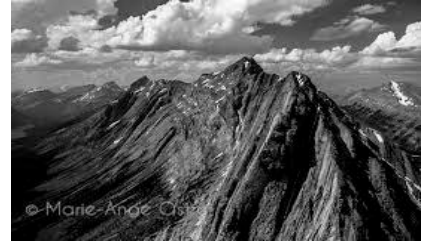
مشهد عدد 1

1_ يتميز المشهد الأول بشدة ارتفاعه مقارنة بالمشهدين 2 و 3 .