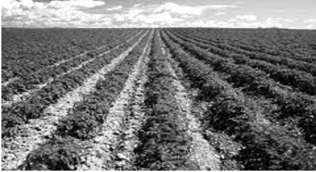
مشهد عدد 3

تبرز المشاهد التالية ثلاثة مظاهر طبيعية تتدخل الصخور في تكوينها: