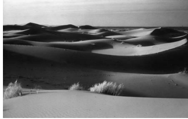
مشهد عدد 2